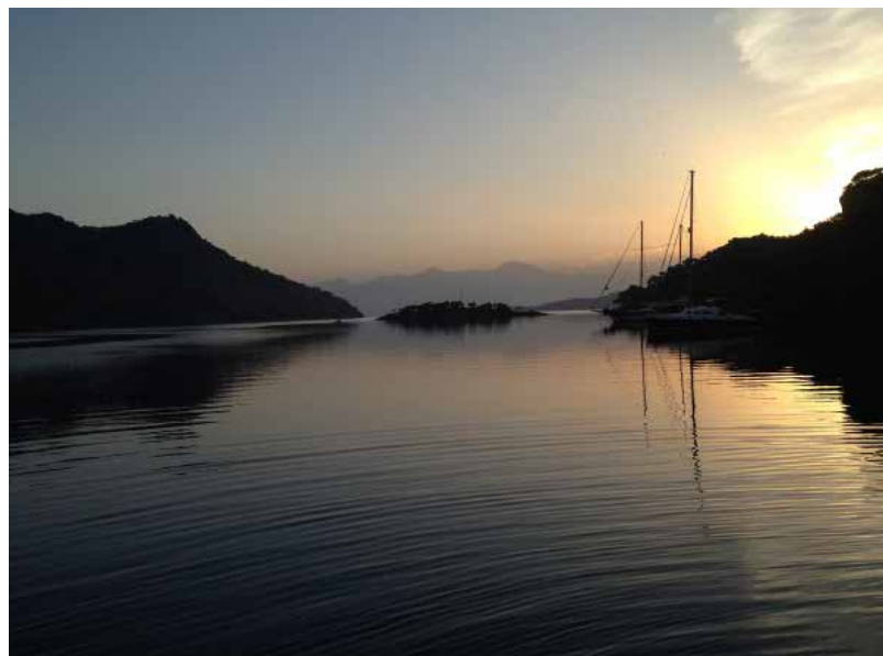
På La Palma kan vi leje cykler op til toppen af bjerget (700m)