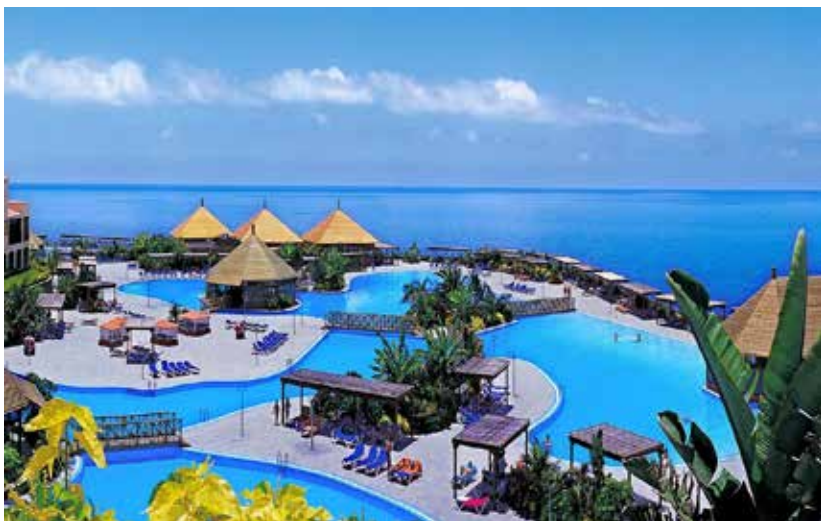
Hotel La Palma Princess

9/2 hjemrejse fra La Palma til Billund og Kastrup.