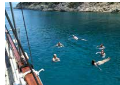
En frisk dukkert midt på dagen