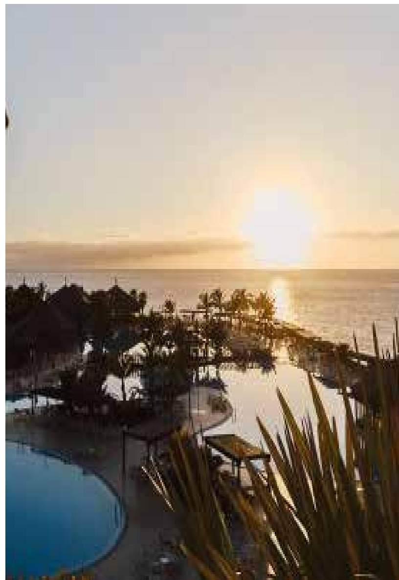
Udsigten mod vest fra La Palma Princess

Det er en forudsætning for deltagelse af man et grundkursus i PSTM og en følelsesforløsende teknik fx. TFT/EFT.